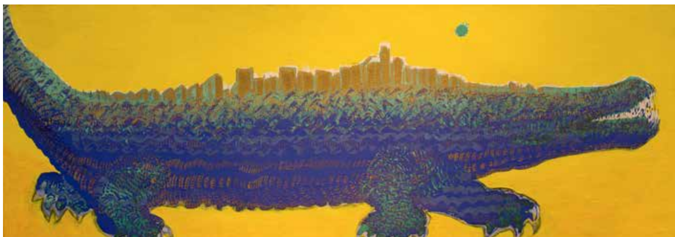
CIUDAD REPTIL Técnica mixta • 35 x 100 cm