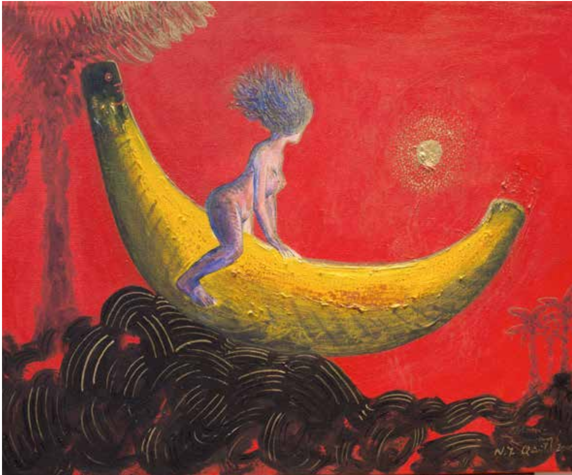
ERÓTICO DE LA SERIE CACIQUE BANANA Técnica mixta • 46 x 61 cm