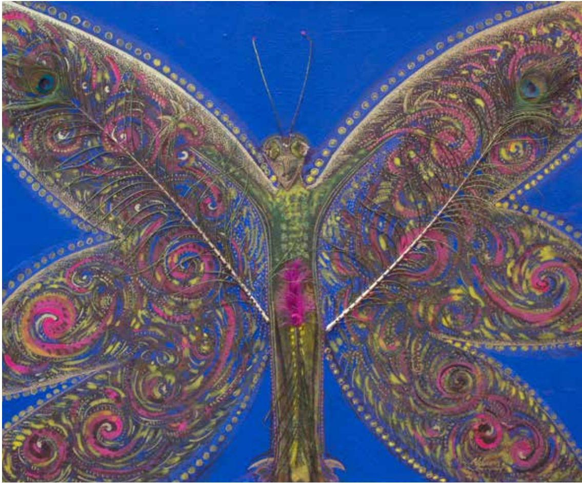
INSECTO DE AXZA 2 Técnica mixta y collage · 65 x 80 cm