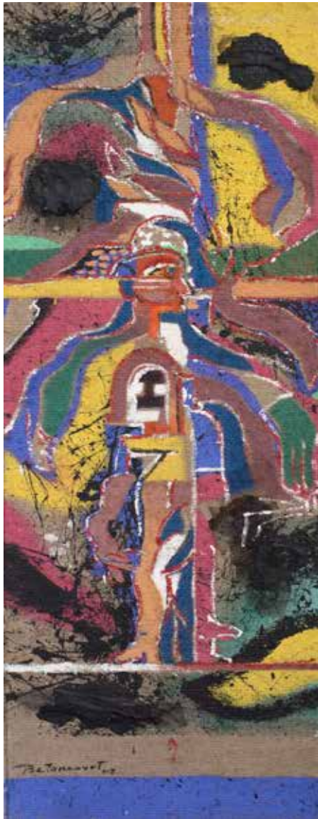
DANZANTES DE IMBABURA Mixta sobre cáñamo • 60 x 197 cm