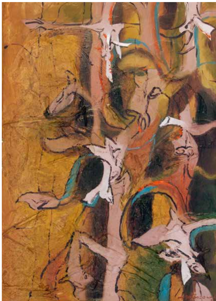
FIGURAS DE BASALTO Mixta sobre lienzo • 50 x 70 cm