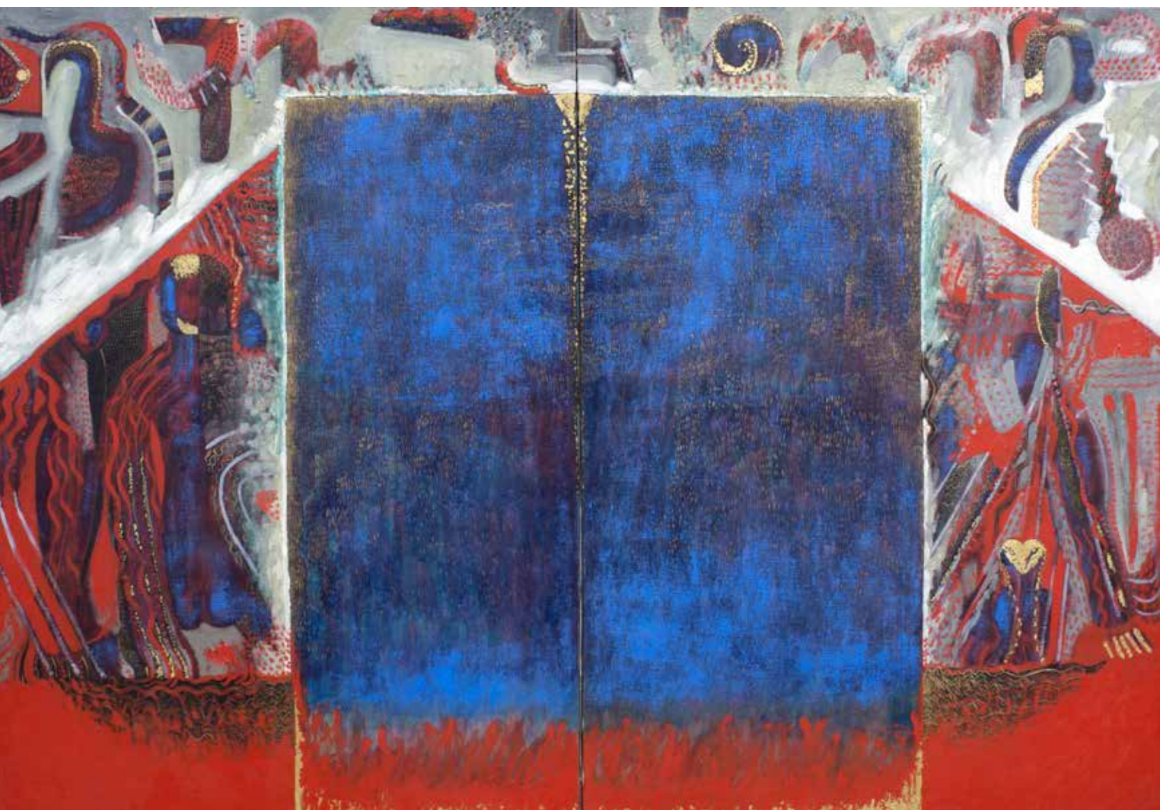
CÓDICE DEL HUMO Técnica mixta • 135 x 192 cm