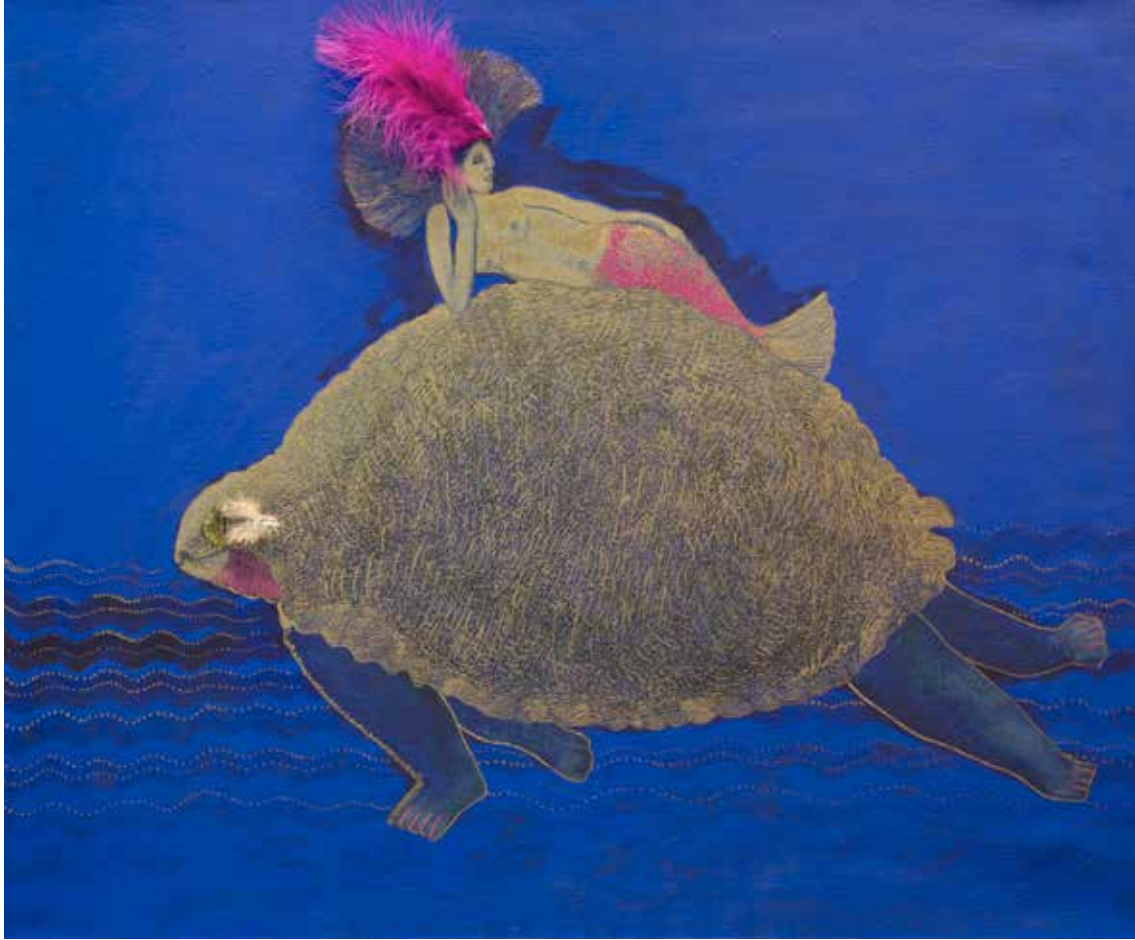
TORTUGA Y SIRENA Técnica mixta y collage • 65 x 80 cm