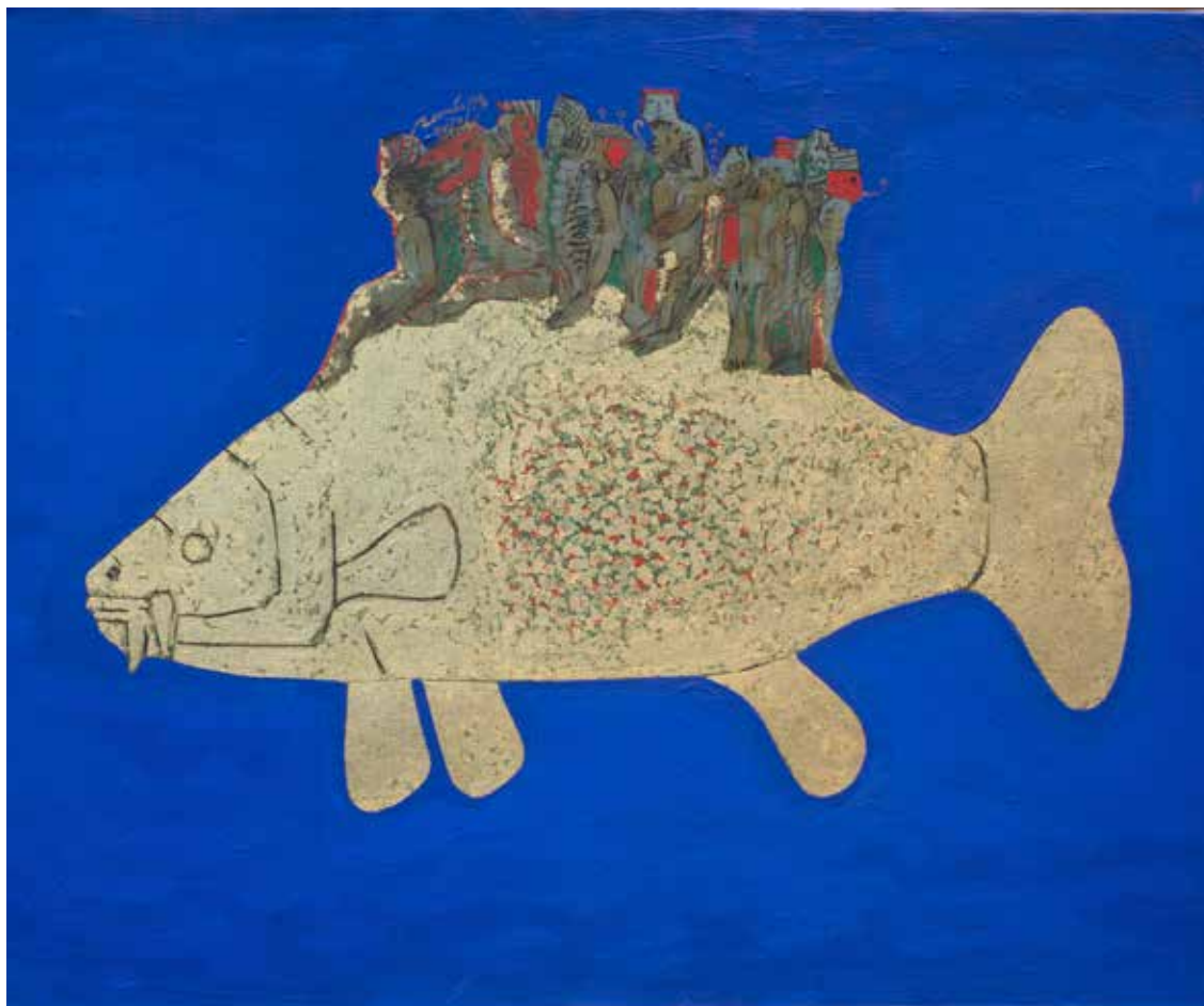
PEZ Y NÁUFRAGOS Técnica mixta • 30 x 40 cm