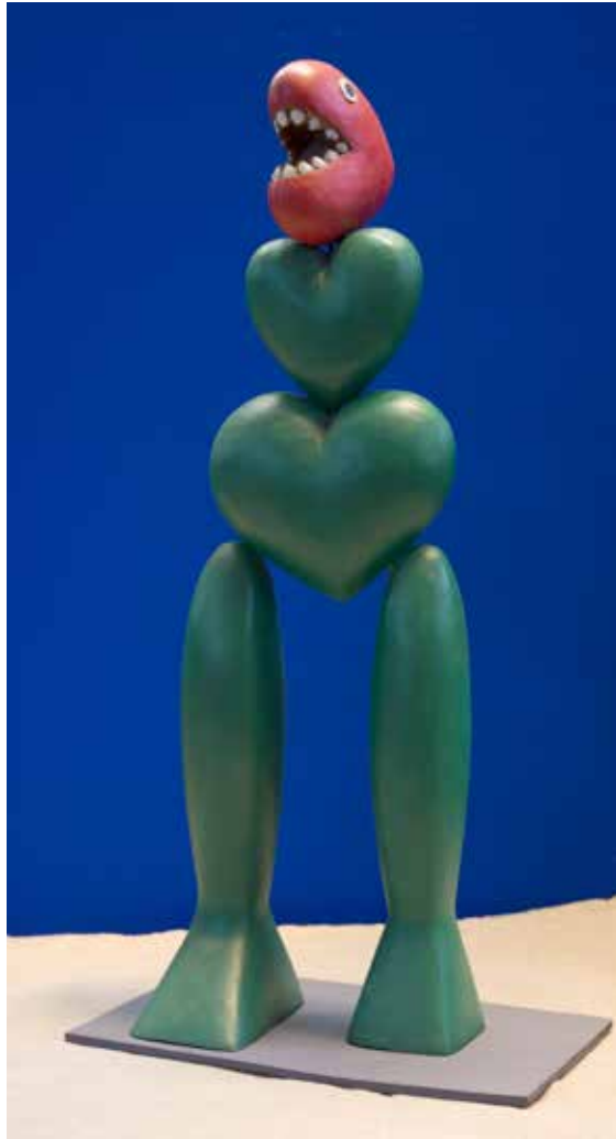
SEÑORITA COQUETONA Madera policromada • 65 x 20 x 32 cm