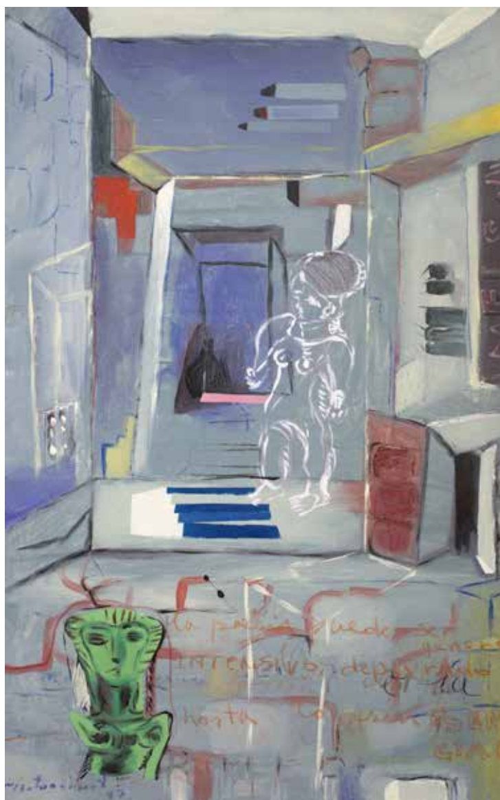
PUERTA SECRETA Mixta sobre lienzo • 70 x 110 cm