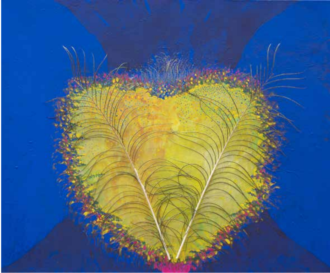
CABEZA DE MOSCA Técnica mixta y collage • 65 x 80 cm