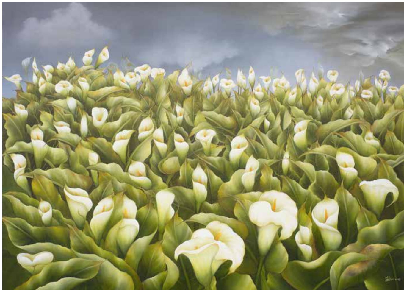
PLANTACIÓN Óleo sobre lienzo - 140 x 100 cm