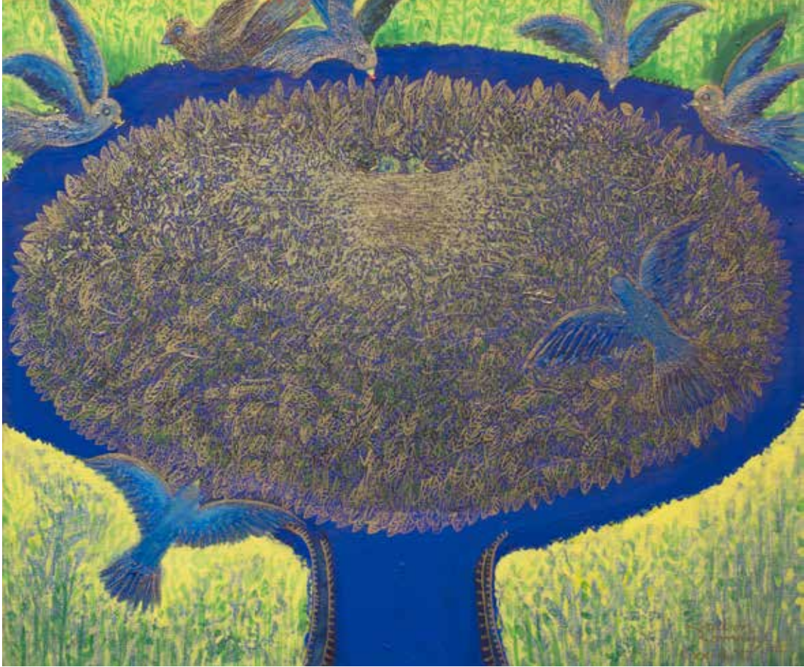
NIDO DE TANGARAS Técnica mixta - 50 x 60 cm