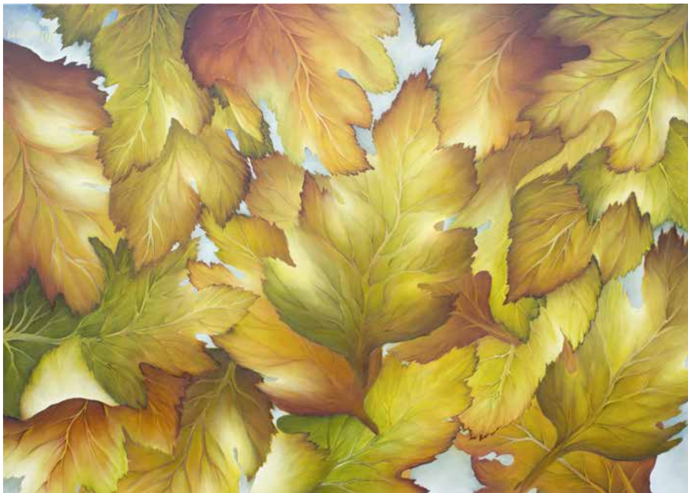
BAMBÚ Y HOJAS Óleo sobre lienzo • 120 x 100 cm