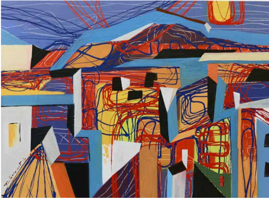
LA NUEVA CIUDAD DE QUITO Mixta sobre lienzo • 70 x 90 cm