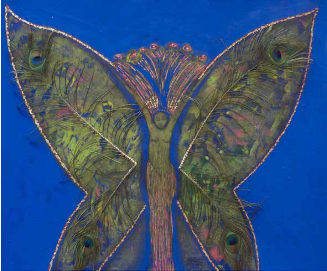
INSECTO DE AXZA 1 Técnica mixta y collage · 65 x 80 cm