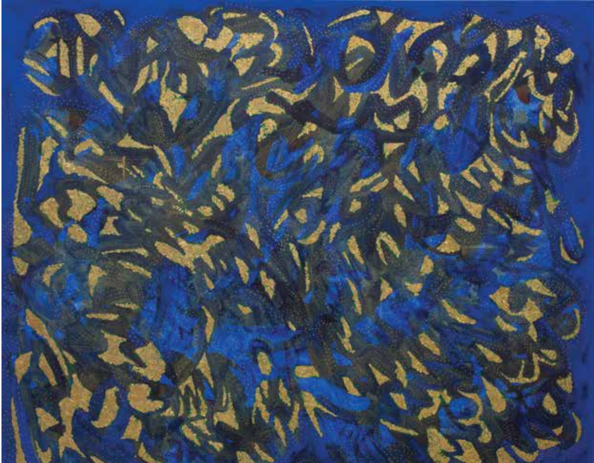
VUELO DE INSECTOS Técnica mixta • 130 x 160 cm