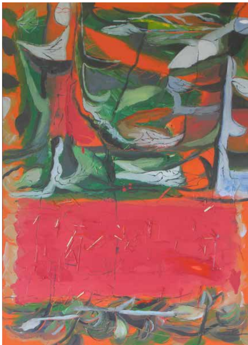
LLAMA VEGETAL Mixta sobre tela • 112 x 162 cm