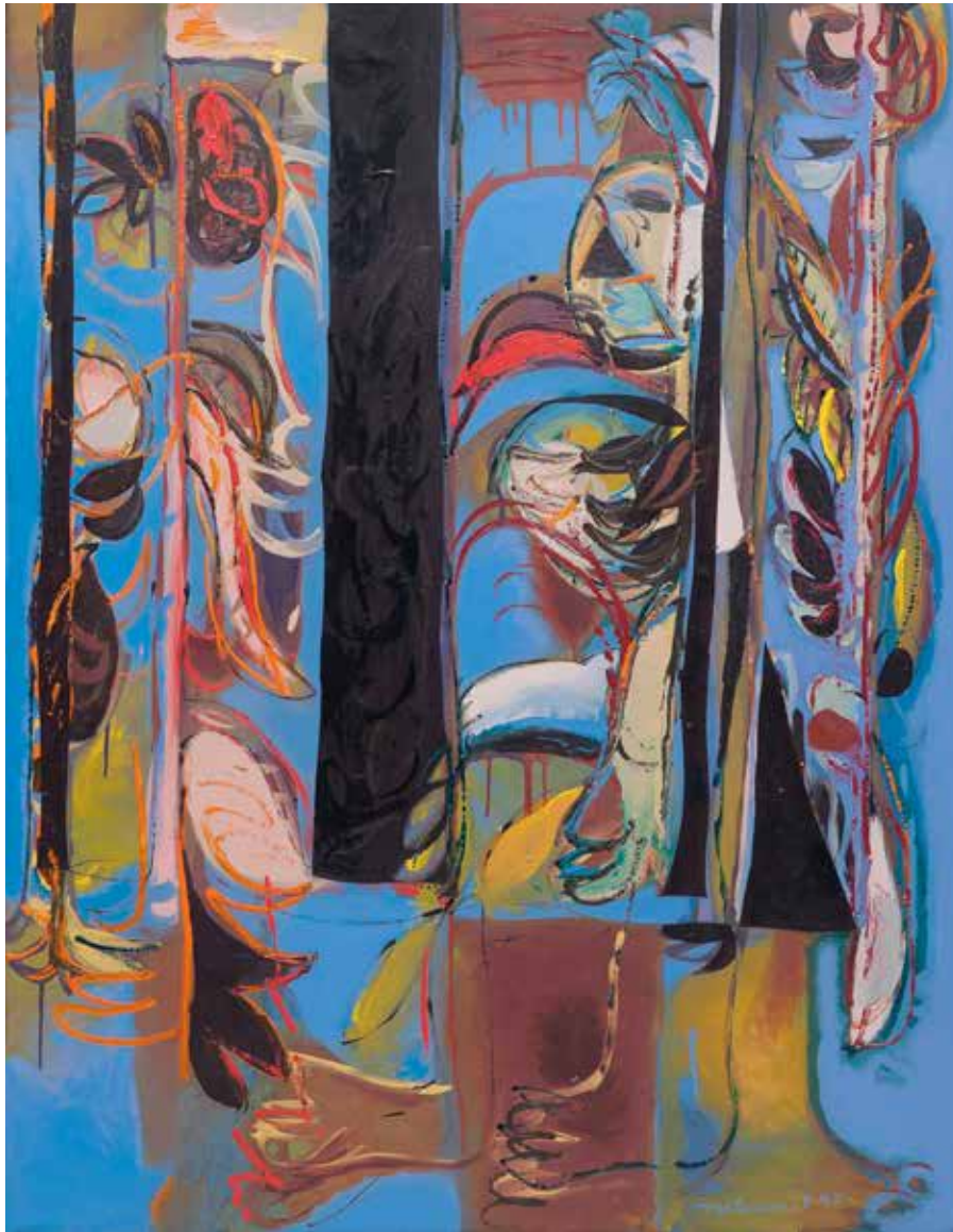
TALLO NEGRO Acrílico sobre lienzo · 110 x 150 cm