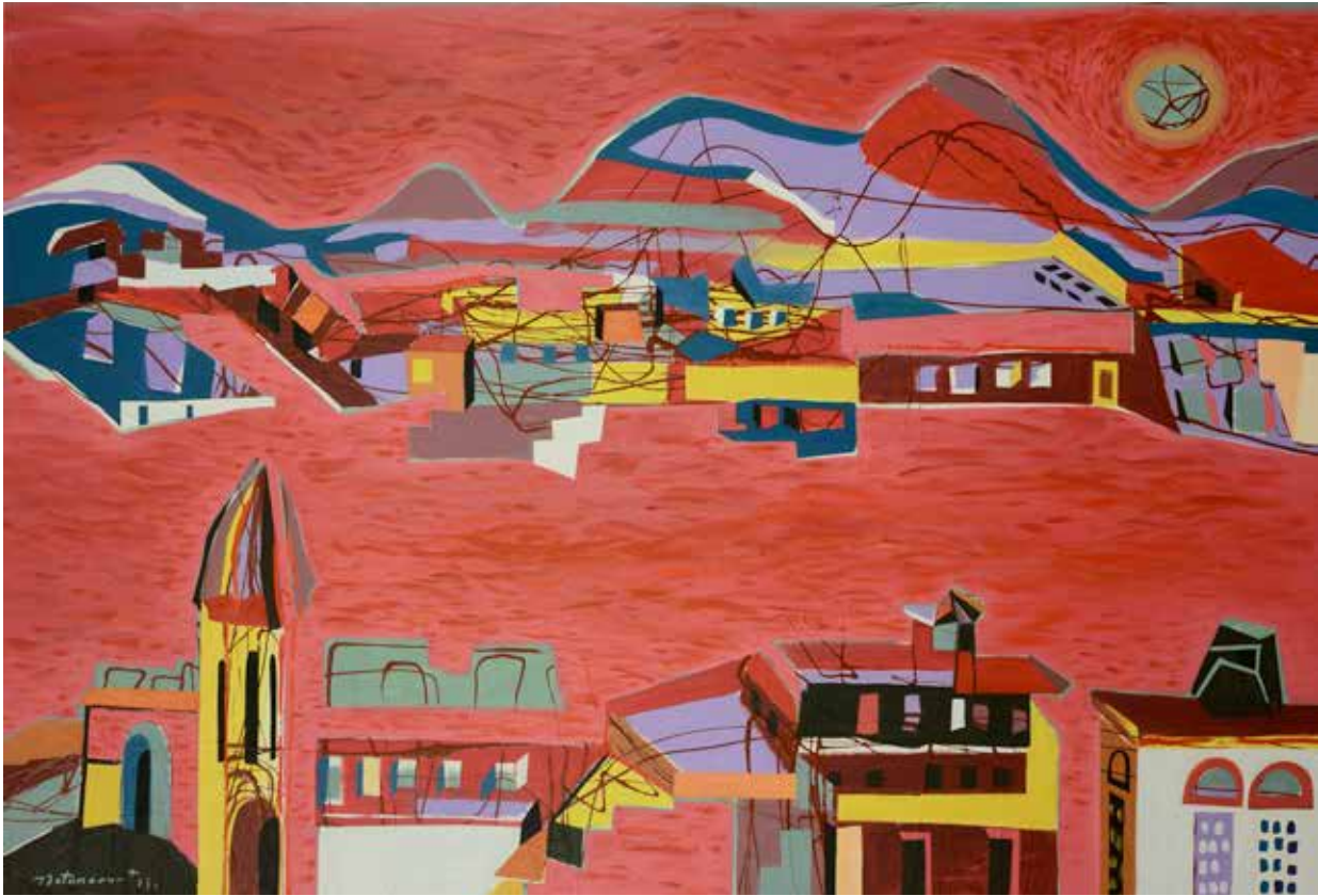
SINFONÍA EN ROJO Mixta sobre lienzo · 153 x 103 cm