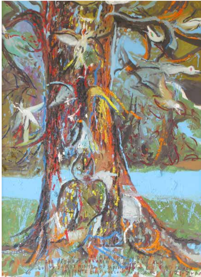
ÁRBOL Y PÁJAROS Mixta sobre lienzo · 140 x 190 cm